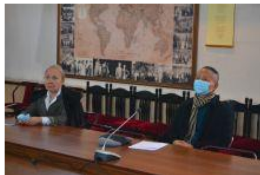
Круглый стол «Вызовы современности и философия»