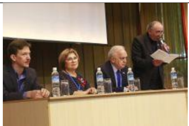
Научно-практической конференции «Вопросы клинической иммунологии и Актуальные вопросы иммуно-дефицитных состояний в педиатрии»

3. Международная конференция «Европейские исследования инновации в науке, образовании, технологии», Лондон, Великобритания. Видео - конференция 03.2020 г.