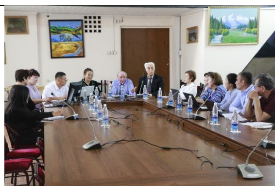
Школа-конференция «Клиническая иммунология, аллергология и инфектология»

8. Кыргызско-Российский Славянский университет выступил онлайн-площадкой международной научно-практической школы-конференции «Клиническая иммунология, аллергология и инфектология». В мероприятии,