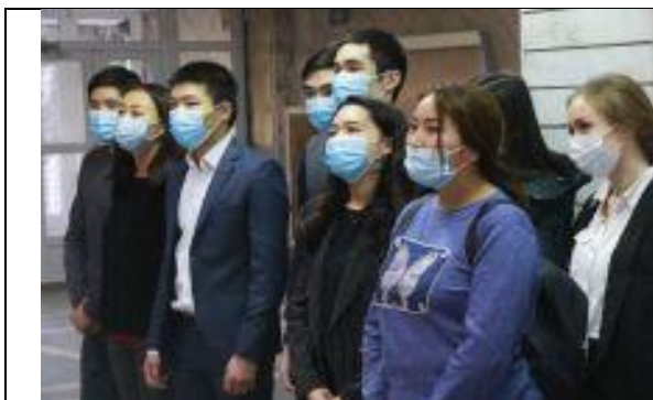
Участники студенческого отряда «Волонтеры Победы»