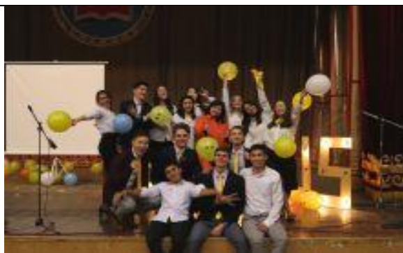
Студенты КРСУ команды «Enactus KRSU» – «Enactus Day».