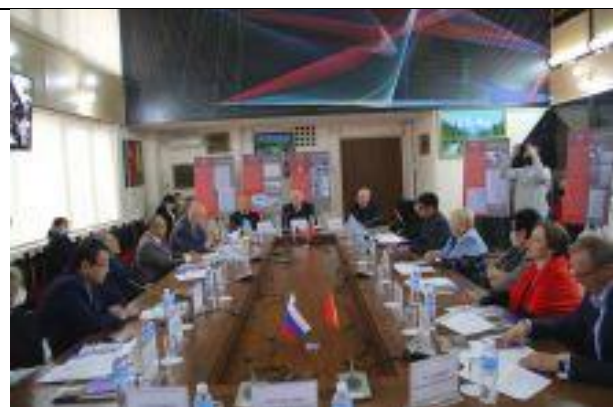
Научно-практическая конференция «Русский язык в Кыргызстане: прошлое, настоящее и будущее»

12. На медфаке КРСУ 18 декабря состоялась XIX итоговая научно-практическая онлайн-конференция ученых и студентов «Молодежное научное творчество – эффективный путь подготовки медицинских кадров». Конференция состояла из шести секций: «Фундаментальная и экспериментальная медицина», «Клинические дисциплины», «Стоматология», «Общественное здоровье и здравоохранение», «Гигиена и адаптация студентов к учебному процессу», «Начинающие исследователи».