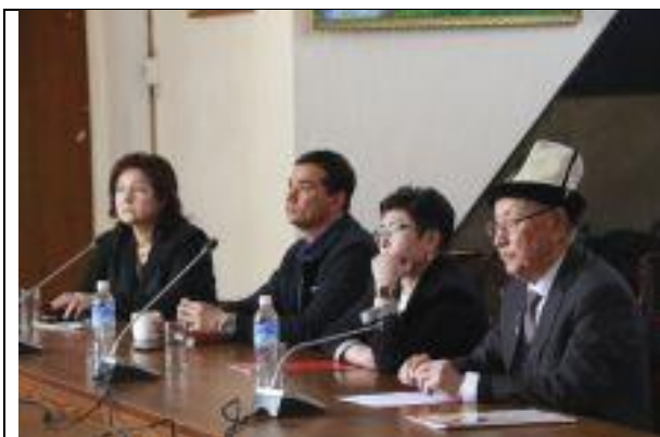
Международной научно-практической конференции «Н. Н. Моисеев о России в XXI веке: глобальные вызовы, риски и решения»

2. Международная конференция XXVIII Моисеевские чтения "Моисеев Н.Н. О России 21 века: глобальные вызовы, риски и решения". В режиме видео-конференции, 2 - 6 марта 2020 г. Москва – Минск – Бишкек – Донецк – Белград. Организаторами выступили Комиссия Российской академии наук по изучению научного наследия академика Н. Н. Моисеева, Научный совет по экологическому образованию Российской академии образования, Международный государственный экологический институт имени А.Д. Сахарова Белорусского государственного университета, Международный независимый эколого-политологический университет (Москва), МГУ им. М.В. Ломоносова, КРСУ им. Б.Н. Ельцина.