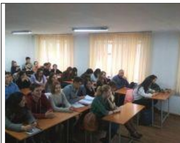
IV научная конференция «Актуальные проблемы философии и политологии»